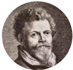
Hendrick Cornelisz de Keyser; architect van de naar hem vernoemde kerk in Middenbeemster.