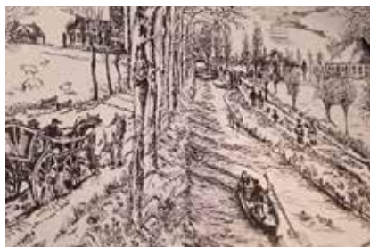
(pentekening Anneke Burger-van der Blom; linksboven is de kerk en het weeshuis duidelijk zichtbaar. Twee vormen van vervoer zijn prominent in beeld gebracht: over het water en over de weg.)

Hout, specie en bakstenen vormen de belangrijkste bestanddelen van de kerk. Vooral stenen. Heel veel stenen. In de wijde omtrek zijn geen bossen en steenbakkerijen. Al het bouw materiaal moet dus (van ver) aangevoerd worden. Schepen en paard en wagen zijn in de zeventiende eeuw de belangrijkste transportmiddelen.