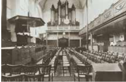
De preekstoel aan de zuidkant en de galerij voor extra zitruimte aan de noordzijde. Daardoor was een achtergang mogelijk.

In de eerste helft van de negentiende eeuw groeit het aantal kerkgangers. Om ruimte te creëren, wordt de kansel verplaatst van de oostzijde naar de zuidzijde. Aan de oost- en noordzijde worden galerijen aangebracht. Dit biedt extra ruimte voor 200 tot 300 bezoekers. Er komt dan ook een extra deur aan de oostzijde van de kerk. Een manshoge witte pleisterlaag aan de buitenkant moet de suggestie wekken alsof de kerk van natuursteen is gebouwd. Wit wordt ook de kleur van de wijzerplaten. Opdat men beter zicht kreeg op de tijd.