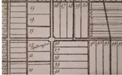
Detail kopergravure Balthasar Florisz van Berckenrode; 1644. Suyd Beemster. Op de kruising Volgerweg/Jisperweg. Waar nu het Hoekje is.

De droogmaking van het meer in 1612 betekent ruim zeventienduizend hectare nieuw land. In te richten naar de nieuwe inzichten van die tijd. De initiatiefnemers tekenen een geometrisch raster van wegen en sloten. Op vijf kruisingen van wegen worden kerkdorpen ingetekend. Vernoemd naar de vier windstreken en het hoofddorp in het midden: Middel Beemster. Dit oorspronkelijke plan is uiteindelijk niet gerealiseerd. Dorpen zijn er niet óf op een andere plek gekomen. Er zijn in de loop der tijd weliswaar meer godshuizen gerealiseerd, maar de Keyserkerk is de enige op basis van het oorspronkelijke plan.