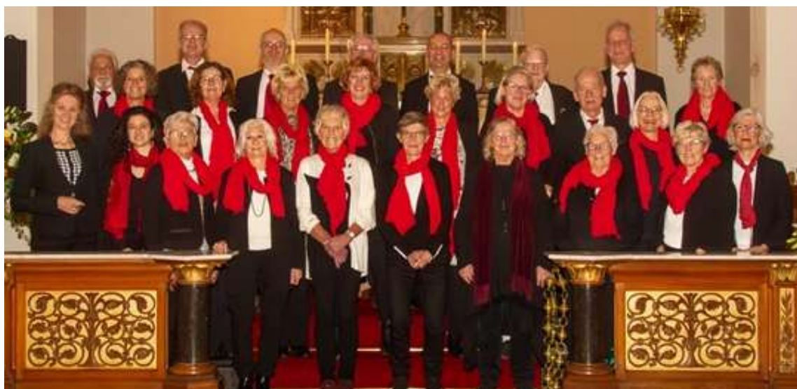
Het RK-koor Caecilia zingt op zondag 25 mei