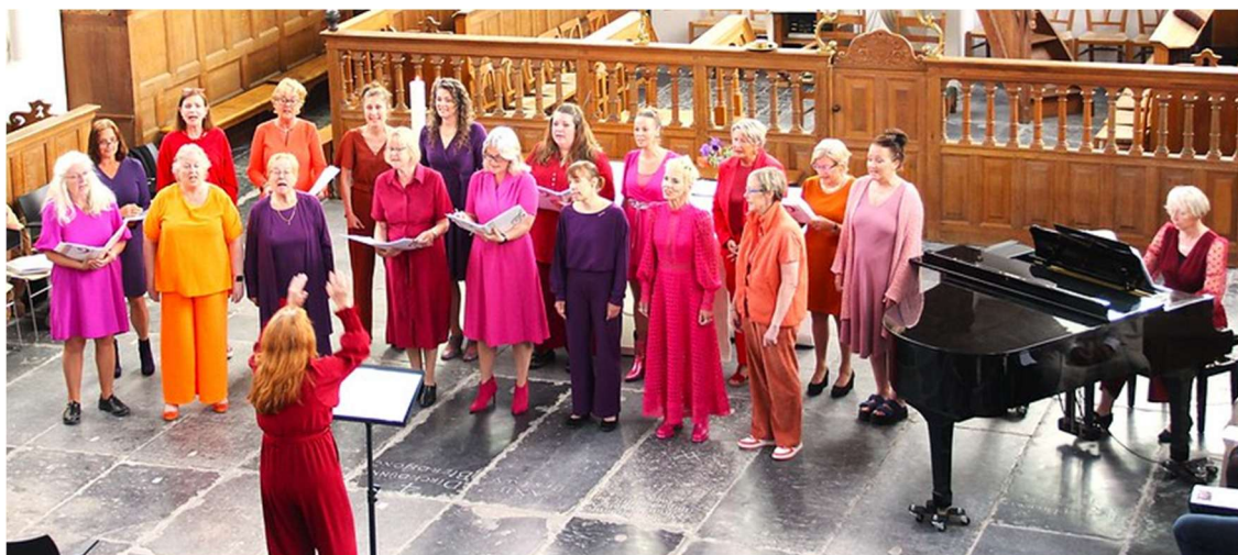
De Beemster Beckies zongen en dansten op zondag 18 mei

Eigenlijk was het de bedoeling om voor de zomer nog een Beemster Korenfestival te organiseren. Dat hebben wij even doorgeschoven naar het najaar of naar volgend voorjaar. Het is dan de bedoeling dat er een feestlied voor het nieuwe Theaterspektakel Bluf! is, wat elk koor ten gehore kan brengen. Maar al was er geen festival, er zingen deze weken wel veel koren in onze diensten.