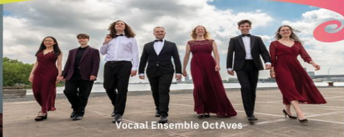
Vocaal Ensemble OctAves