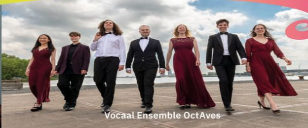
Vocaal Ensemble OctAves